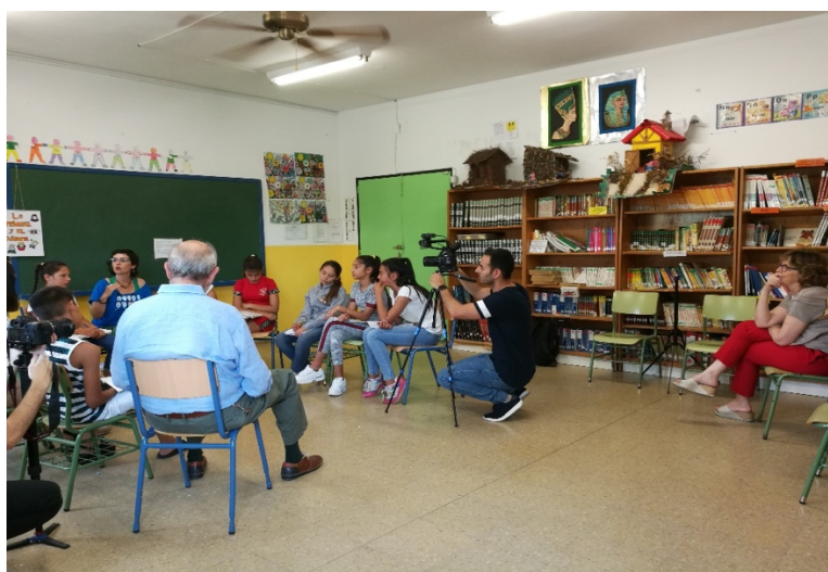
Figura 3. Grabación de tertulia literaria dialógica. Curso 5º. Colegio “Albolafia”

En sucesivas ediciones de este proyecto continuaremos incorporando experiencias de otros centros. De esta forma tendremos un material muy útil para la formación inicial en la Facultad, así como también para la formación permanente del profesorado (Fig. 3)