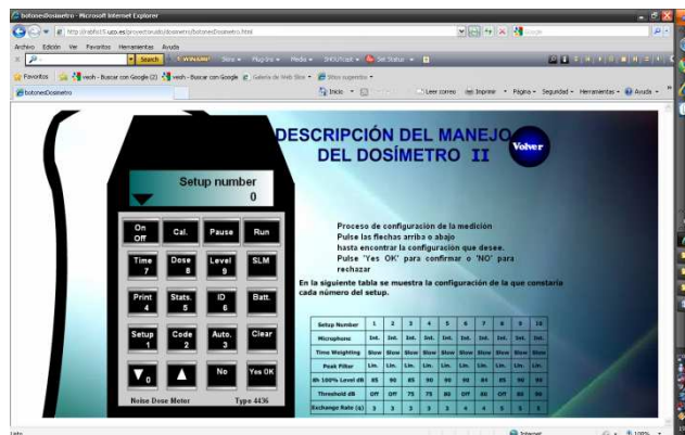
Figura 4: Manejo del dosímetro

En cuanto a los laboratorios, dependiendo del aparato a simular, el técnico debe introducir datos para una correcta simulación. Asimismo, se tiene la posibilidad de consultar la explicación de funcionamiento de los aparatos y manipularlos. Para asegurar el correcto aprendizaje del usuario, el sistema garantiza que si éste es la primera vez que accede al sistema, realice unas actividades básicas sobre el funcionamiento del instrumental para luego poder ascender en la dificultad de las mismas. (Figura 4 )