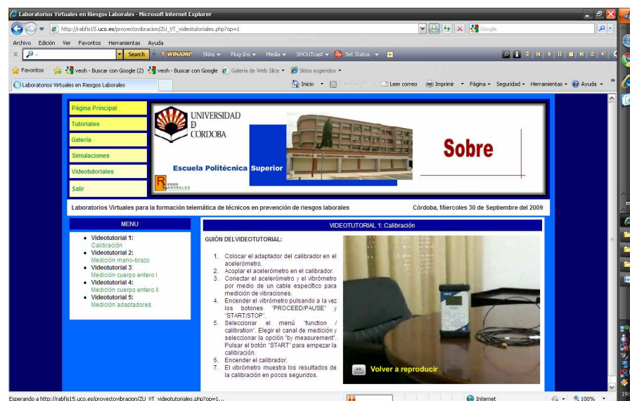
Figura 6: Videotutoriales

El usuario puede completar su aprendizaje a través de vídeos que le facilitan información complementaria sobre ciertos aspectos incluidos en otros módulos de la aplicación.