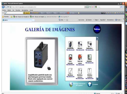
Figura 2: Galería de imágenes

Mediante el uso de una plataforma multimedia en la que a través de animaciones y una interfaz atractiva que ameniza el aprendizaje al usuario, se le aporta toda la teoría necesaria para la óptima comprensión en el campo del ruido industrial, así como una completa descripción del instrumental necesario en la medición y prevención del ruido junto con video-tutoriales explicativos que facilitan el manejo de los mismos. Todo ello, proporcionando además los conocimientos respecto a restricciones legales de este campo existente en la normativa vigente en la actualidad. (Figura 2 y 3)