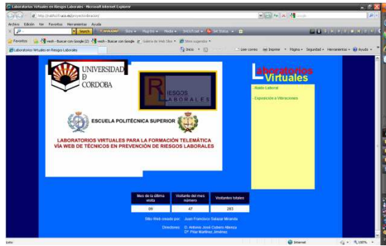
Figura: Pantalla de inicio al portal de Prevención de riesgos laborales

Con ello desaparecen los inconvenientes que el aprendizaje en un laboratorio real conlleva: